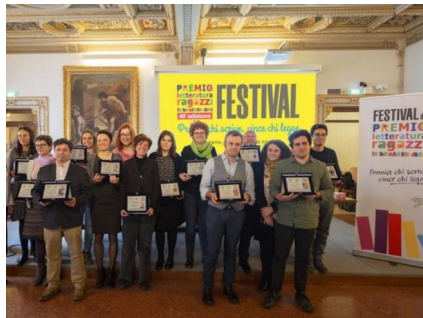
la premiazione della 40ª edizione del Premio Cento

Una storia che mescola scienza e romanzo; una favola sul potere e la libertà; la vita di una famiglia vista e raccontata da un cane. Sono i temi dei tre libri finalisti nella sezione scuola primaria, alla 41ª edizione del Premio Cento di Letteratura Ragazzi. Si tratta di La danza delle rane (Editoriale Scienza) di Anna Vivarelli e Guido Quarzo, illustrato da Silvia Mauri, sull'abate e biologo Lazzaro Spallanzani; de I cuscini magici dello scrittore greco