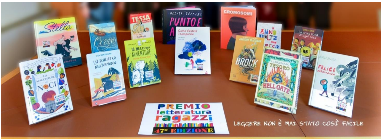
Figura 1 Libri finalisti 47ª edizione